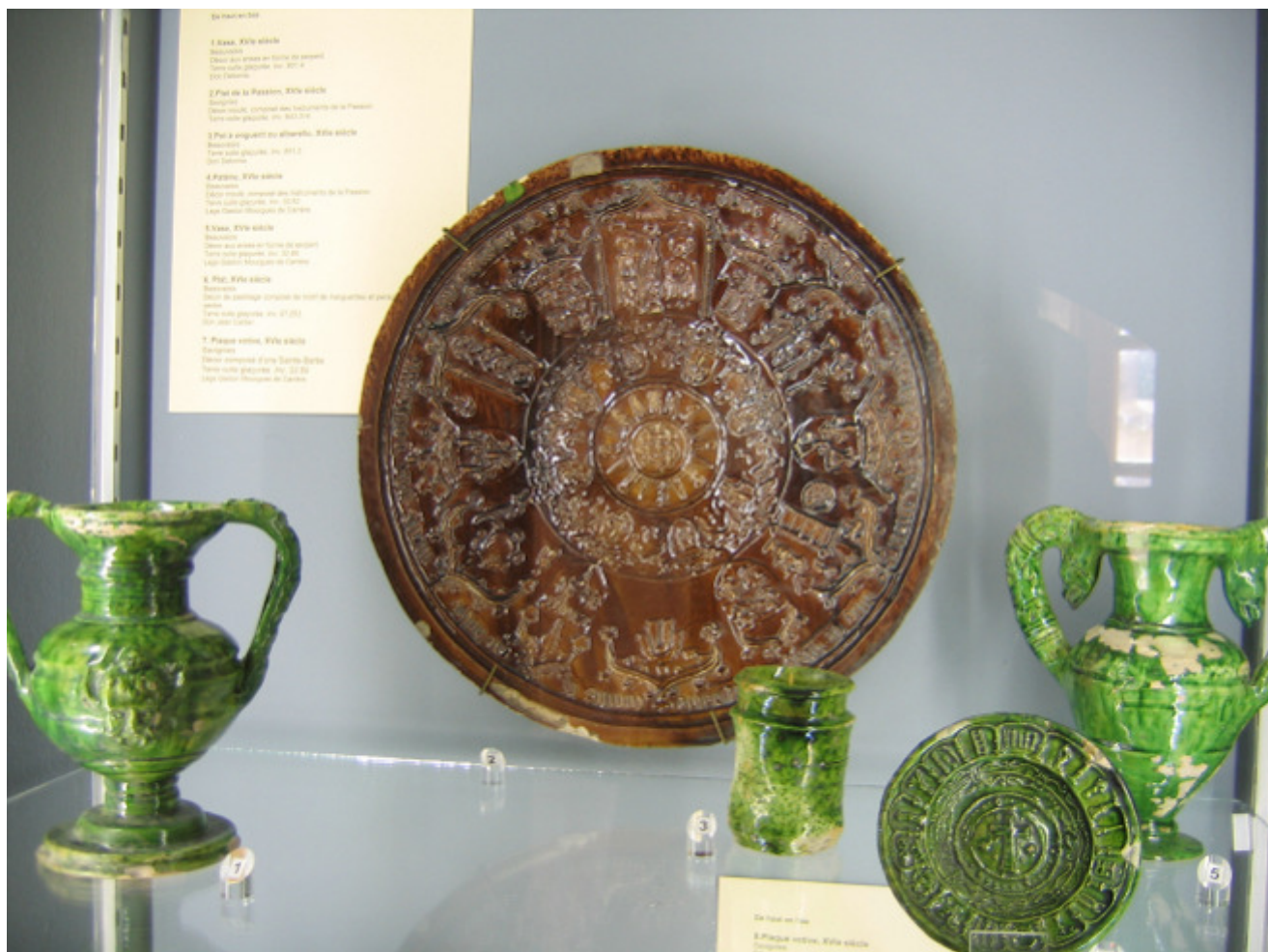
Le Plat de La Passion de Savignies