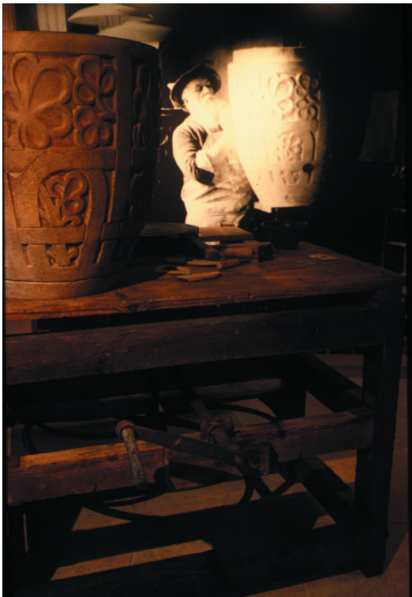
Auguste Delaherche, Musée de La Chapelle aux Pots