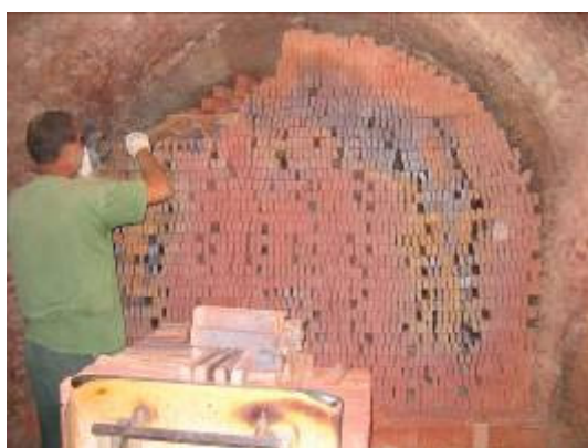
Briquetterie DeWulf, sortie du four

Bref, toutes les conditions sont réunies pour un échange privilégié avec les potiers. En 2004, 4000 à 5000 curieux et connaisseurs s'étaient donnés rendez-vous à la Fête de l'argile, De briques et de pots.