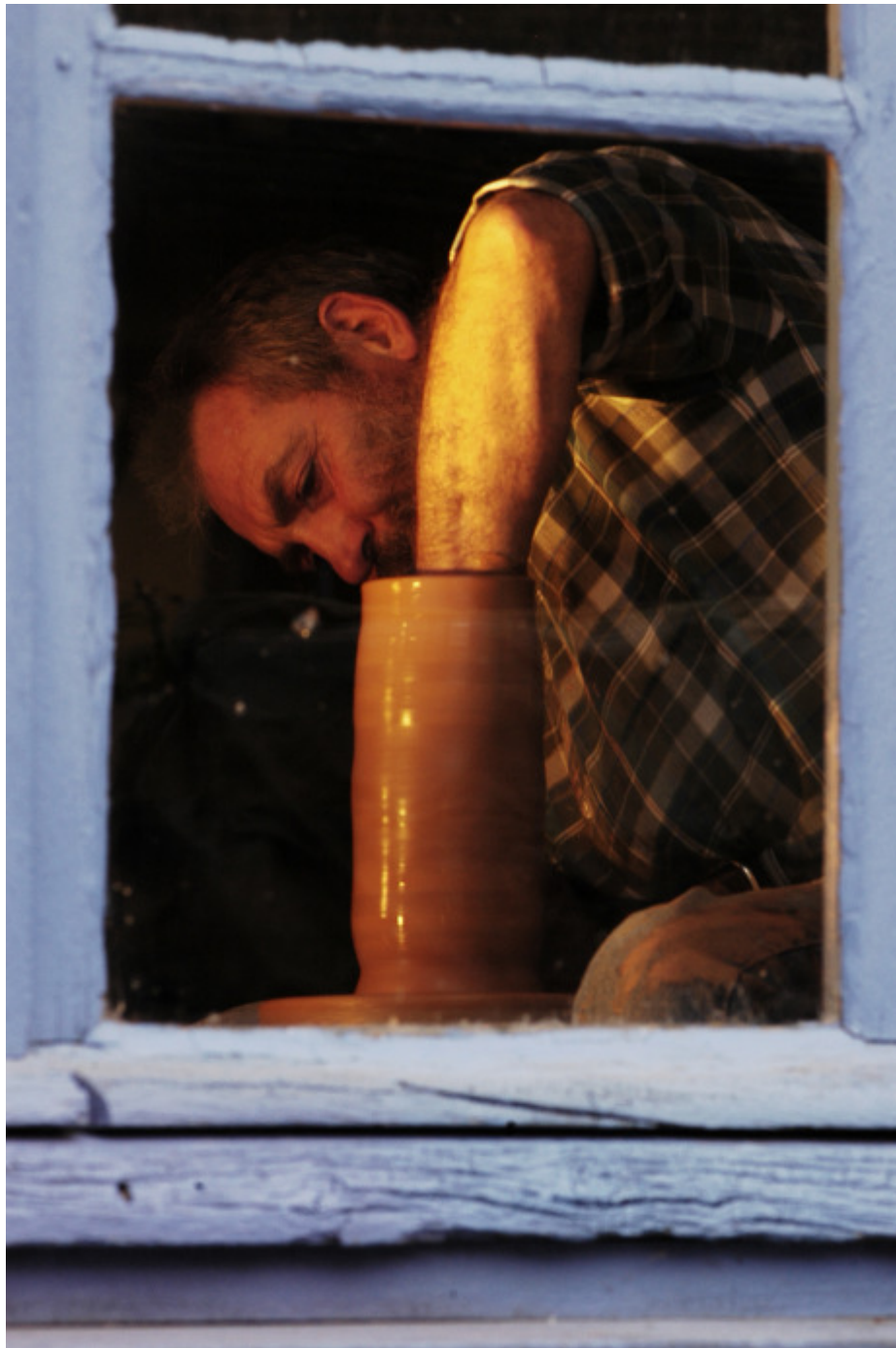
Atelier de potier à Savignies